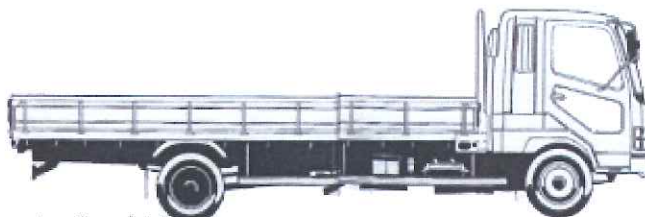
バンパー凹み・カバー割れ